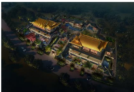
绵阳·大宝山“红叶谷巴蜀汉文化农耕民俗国际养生体验村”景观亮化工程