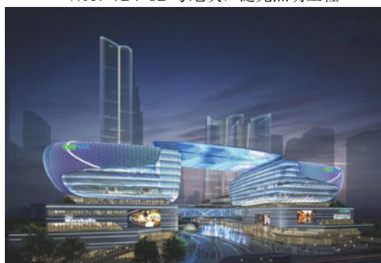
(武汉) 新建商务、商业设施、绿地与广场项目 (杨春湖启动区 A 地块) (南区/北区) 一期裙楼泛光照明分包工程