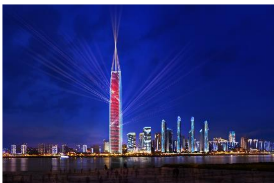
武汉绿地国际金融中心项目 A01-1 地块主楼 1#楼灯光秀安装工程

1、跨区域经营能力持续提高。公司已在全国拥有3家全资子公司、6家分公司，已构建了深耕华北、华东、华中、西南、华南市场，辐射全国的市场网络布局。报告期内，公司基于国际化经营发展战略，在阿联酋投资设立子公司，截至本报告披露日，相关审批或备案手续正在办理中，如本次对外投资设立顺利达成，将为公司海外业务的开展提供有效通道，进一步提高公司综合竞争实力和未来持续发展动力。报告期内，公司新增承接主要项目如下：