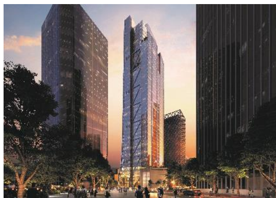
（深圳）卫星通信运营大厦泛光照明工程