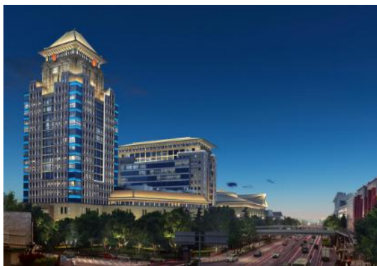
（北京）中关村大街沿线夜景照明工程（二期）