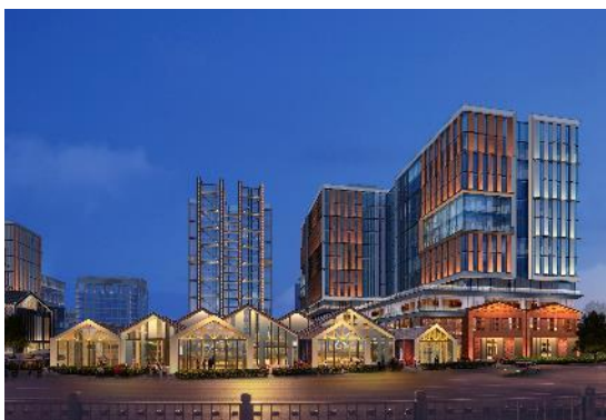
(北京) 新首钢国际人才社区(核心区南区) 项目建筑泛光照明设计