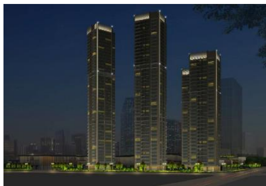
(深圳) 深国际前海颐湾府泛光照明工程