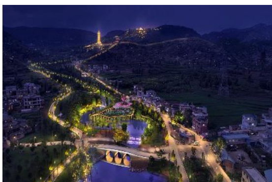
弥勒市甸溪河一期智慧夜游项目设计施工总承包 (EPC)