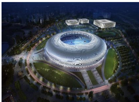
(成都)东安湖体育公园一场三馆项目泛光照明承包工程