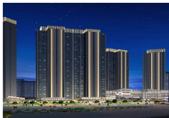
(武汉) 新建文化设施、居住、公园绿地项目 (7A、7B、8B 号地块) 泛光照明工程