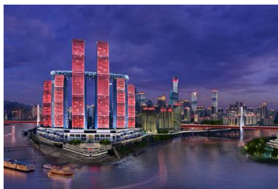
重庆主城区“两江四岸”文旅项目--夜市开灯仪式工程三标段