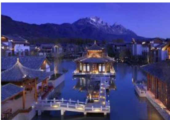
(北京) 雁柏山庄项目泛光照明工程