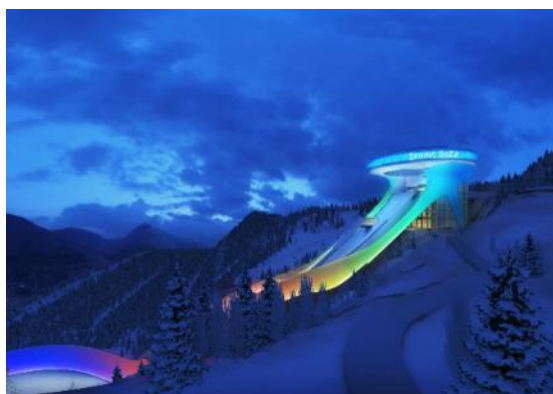
北京 2022 年冬奥会和冬残奥会张家口赛区张家口奥运村及古杨树场馆群建设项目-北欧中心跳台滑雪场（国家跳台滑雪中心雪如意）智慧照明系统及智慧夜游运营系统工程 EPC 总承包