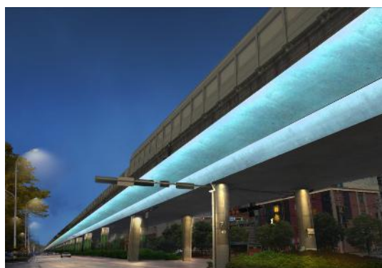
(荆州) 2020 年度市中心城区照明工程及 2019 年度中心城区路灯工程等建设项目总承包